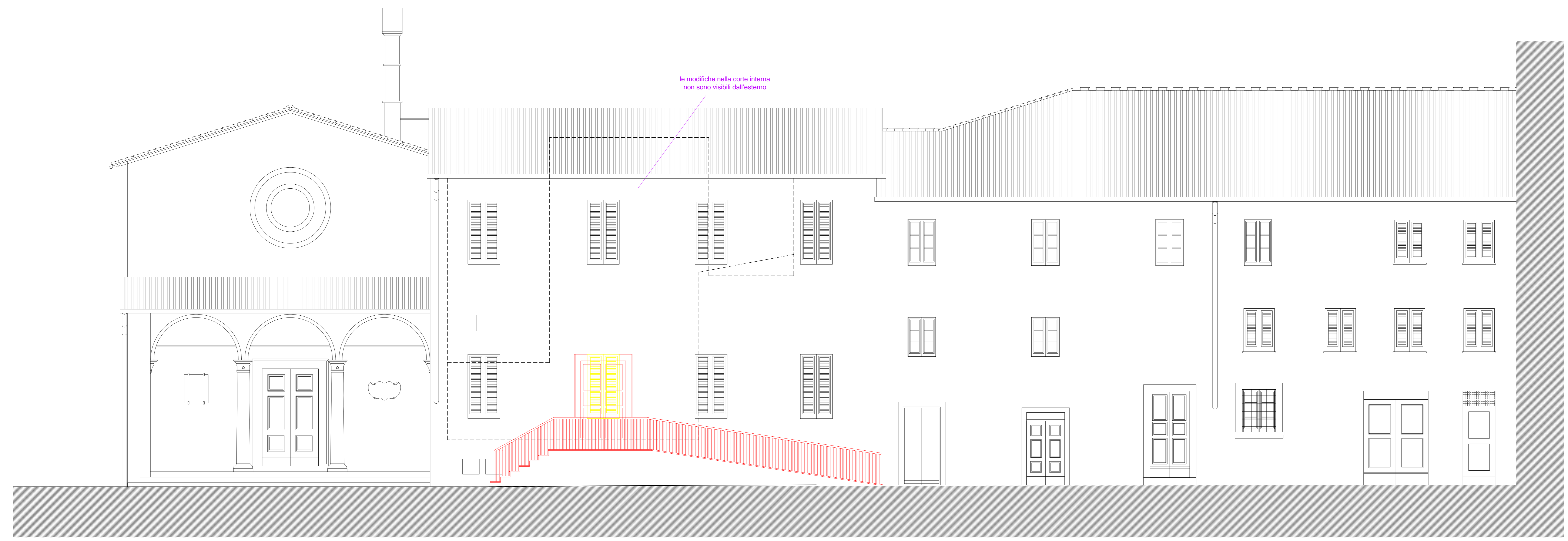
PROSPETTO SU VIA ROMA